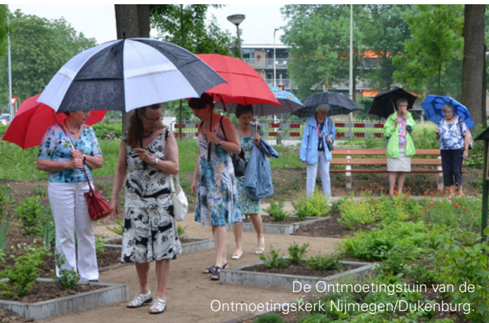
De Ontmoetingstuin van de Ontmoetingskerk Nijmegen/Dukenburg.