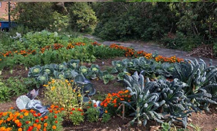
De parochiemoestuin Hof van Heden van de Lourdeskerk Nijmegen.