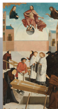
Kaartenset met schilderijen