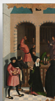
Makers van cd Seven acts of Mercy (zeeuws trio Sunshine Cleaners)