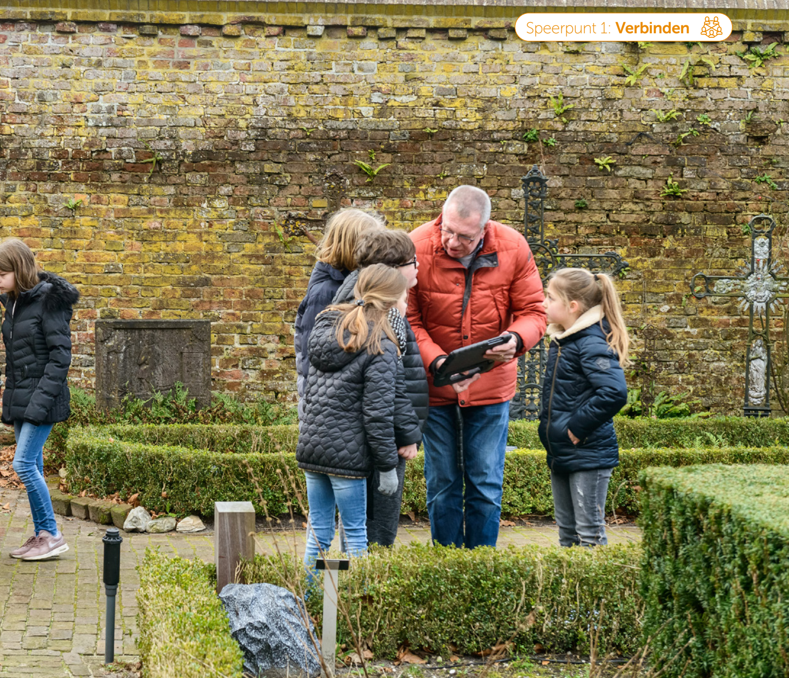
Scholieren zijn druk bezig met de Alternate Reality Game

reacties en interesse. Ze stellen zich meer open voor bezinning, religie en geloof, wat hopelijk leidt tot meer begrip voor elkaar."