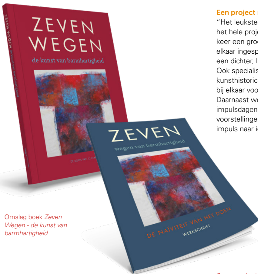
Omslag boek Zeven Wegen - de kunst van barmhartigheid