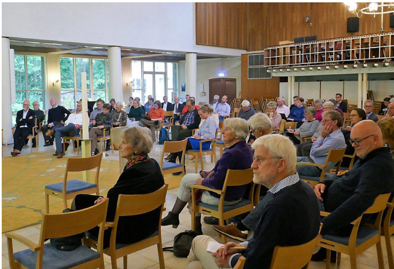
Studiemiddag voor theologen waarbij predikanten werden toegerust om te (s)preken over dit thema.