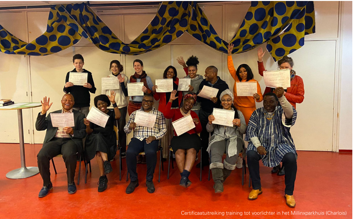
Certificaatuitreiking training tot voorlichter in het Millinxparkhuis (Charlois)